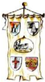
Ente Sagra delle Castagne