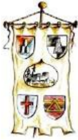
Ente Sagra delle Castagne